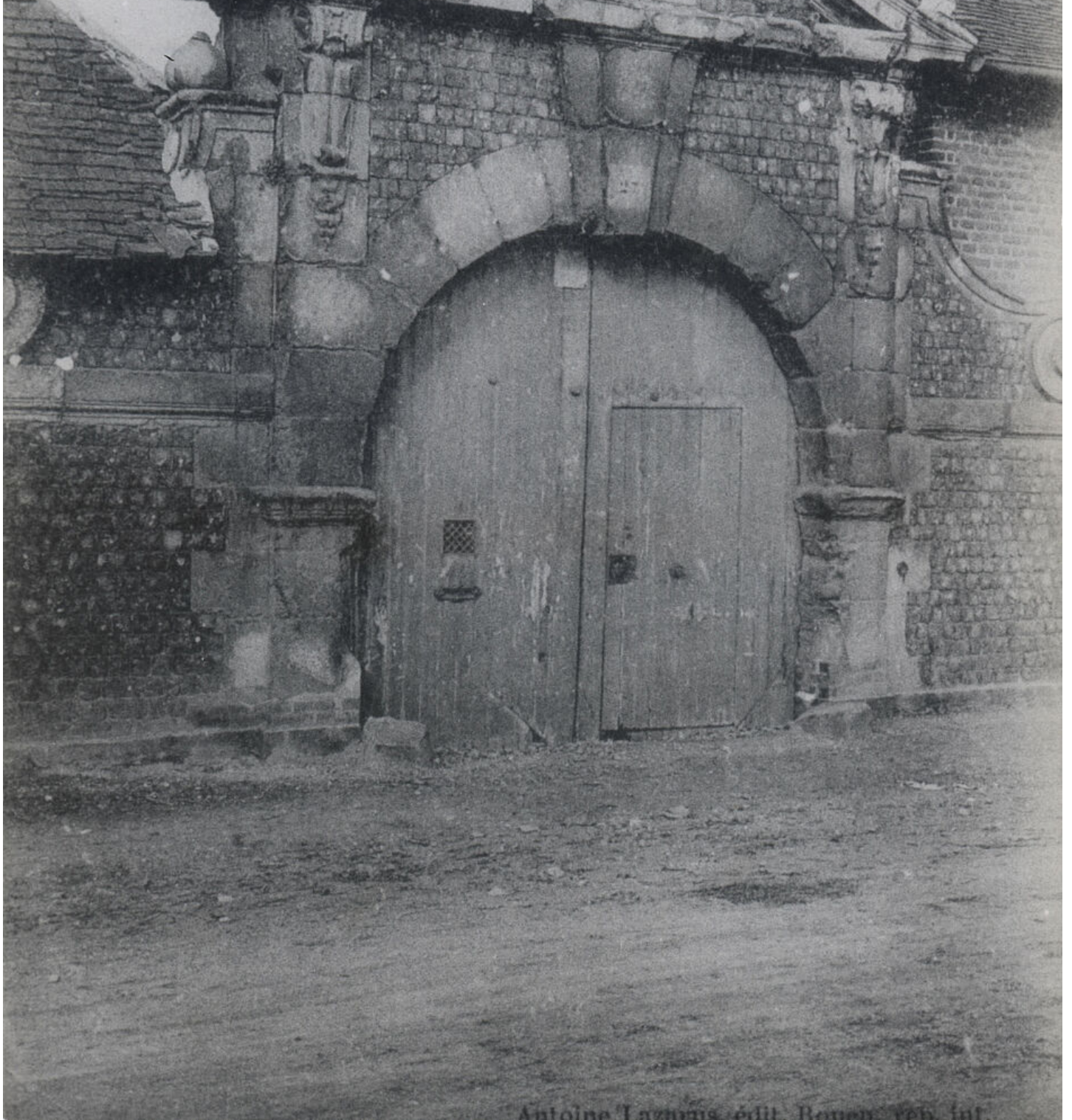
Antoine Lacroix édité. Rennes, rev. int.